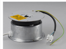
Table tournante pour charge 10Kg avec collecteur d'électricité #SWD100 Mains power turntable for 10Kg load, with collecting ring #SWD100