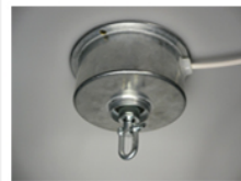
Moteur pour suspension 20Kg #SWD200H Mains power ceiling mounted motor unit for hanging load 20Kg #SWD200H