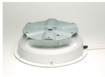
Plateau tournant motorisé pour charge 50Kg #SW500 Mains power turntable 50Kg load #SW500