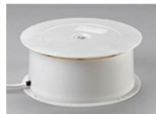
Plateau tournant motorisé charge 5Kg #S080 Mains power turntable 5Kg load #S080