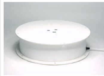
Table tournante motorisée 300Kg de charge #SW3000 Mains power turntable load up to 300Kg #SW3000